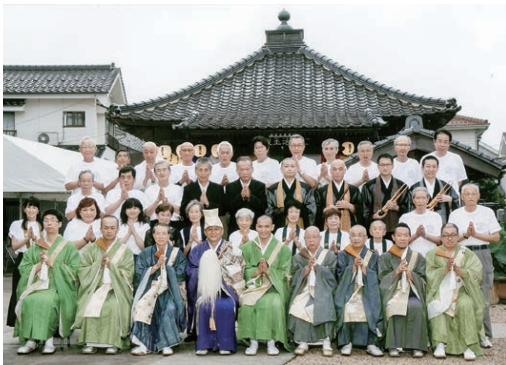
聖徳太子1400年大祭 令和4年7月22日～25日