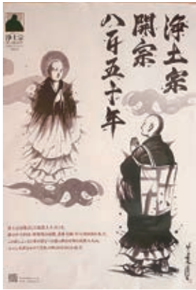
浄土宗からのポスター

こんな時代だからこそ目先の御利益を唱え、勧誘してくる宗教が増えてくるのも当然なのでしよう。「この壺を買えば地獄に墮ちているあなたのご先祖を救うことができます。」統一教会しかり、目先の御利益をすすめる、勧誘してこようとすると宗教には、